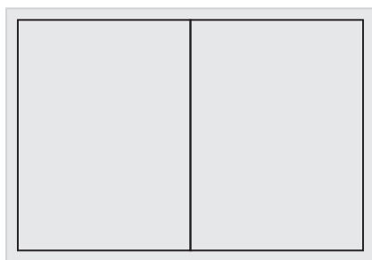
2 strony 420x280mm