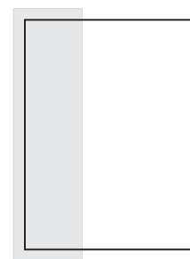
1/3 strony 70x280mm